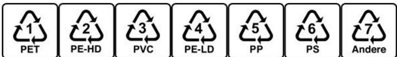
Illustration1: symboles 1 à 7 des matières plastiques.

La question de la collecte des barquettes de salade, de produits carnés ou de fromage, ou d’autres emballages en plastique, se pose régulièrement. Le recyclage de ces emballages en matière plastique n’est pas judicieux à l’heure actuelle, tant au niveau écologique qu’économique. Bien que l’installation de tri soit en mesure de les distinguer des bouteilles à boissons en PET ou des bouteilles en plastique à usage ménager, les plastiques – en partie composites, souvent souillés – ne peuvent retrouver leur forme d’origine et faire l’objet d’un recyclage de qualité. Ils se retrouvent en fin de compte dans les ordures ménagères. Le détour par l’installation de tri n’est donc pas nécessaire.